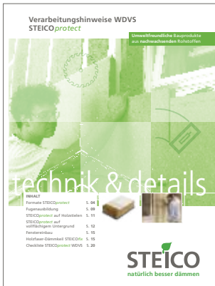
Bild 1: Die neuen Verarbeitungshinweise STEICOprotect beschreiben leicht verständlich und eröffnen dem Holzbauer ein neues Geschäftsfeld.