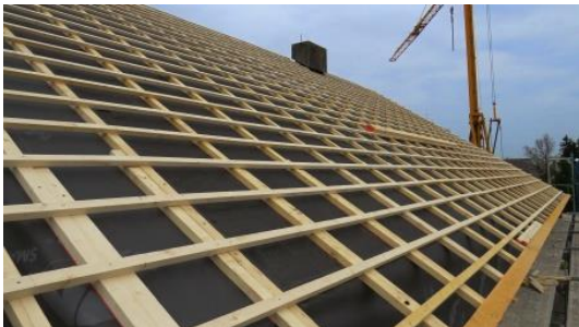
KRONOPLY safe mit Konterlattung und Lattung als fertig ausgebildete Traufe des Unterdaches