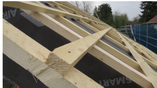
Hervorragend ausgeglichene Dachfläche dank Doppelgewindeschraube

Die Holzfaserdämmung brachte auch Vorteile für den neu entstandenen Wohnraum. Das Material aus natürlichen Holzfasern wirkt feuchteregulierend und trägt so zu einem gesunden Raumklima bei. Die hohe Dichte und die gute Wärmespeicherkapazität schützen im Sommer effektiv gegen die Hitze und halten im Winter die Wohnräume warm. Die Bauherren sind mit dem Ergebnis sehr zufrieden: „Die Aufdachdämmung mit KRONOPLY safe bei der energetischen Sanierung hat uns gleich mehrere Vorteile gebracht: Wir haben neuen Wohnraum gewonnen, zahlen jetzt weniger Heizkosten und genießen das gesunde Raumklima.“