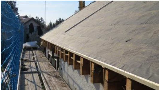
Flächig verlegte KRONOPLY safe auf rauer Bretterschalung